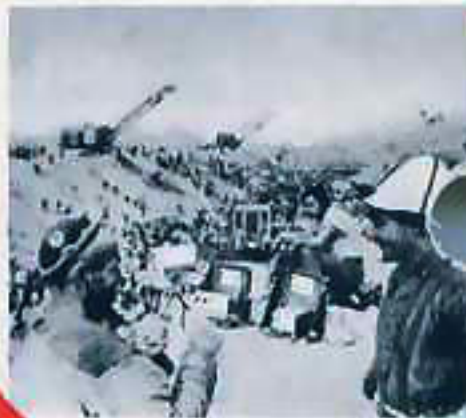
1939 год. У микрофона Московского радио строители Ферганского канала.

Из Кремля хорошо просматривалось Замоскворечье, где инженер Шухов возводил невиданную металлическую конструкцию. И Ленин, следивший за строительством, радовался, что радиобашня все выше поднималась над столицей. Покорить страну сетью радиотелефонных аппаратов, говорил Ильич, значит получить в свои